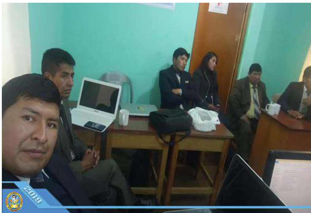
Auto Evaluación del Programa de Estudios de Computación e Informática