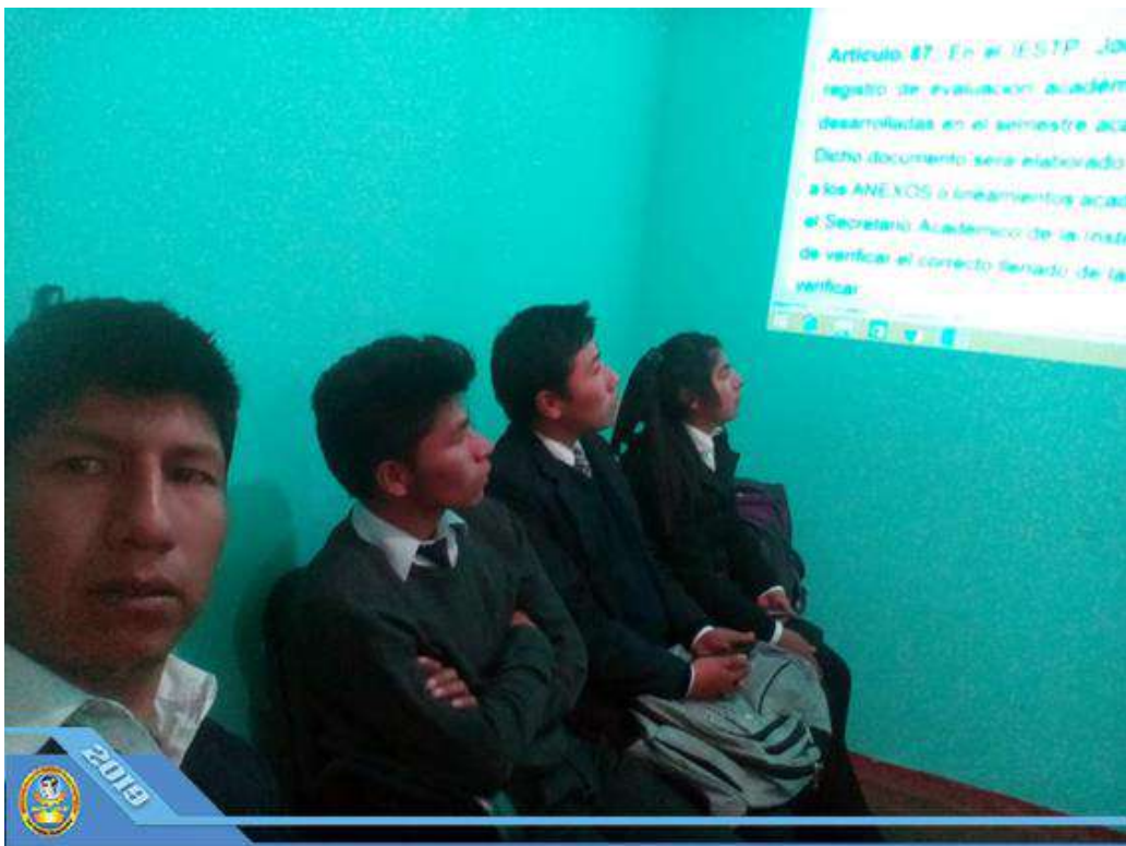
Propuesta de Gestión