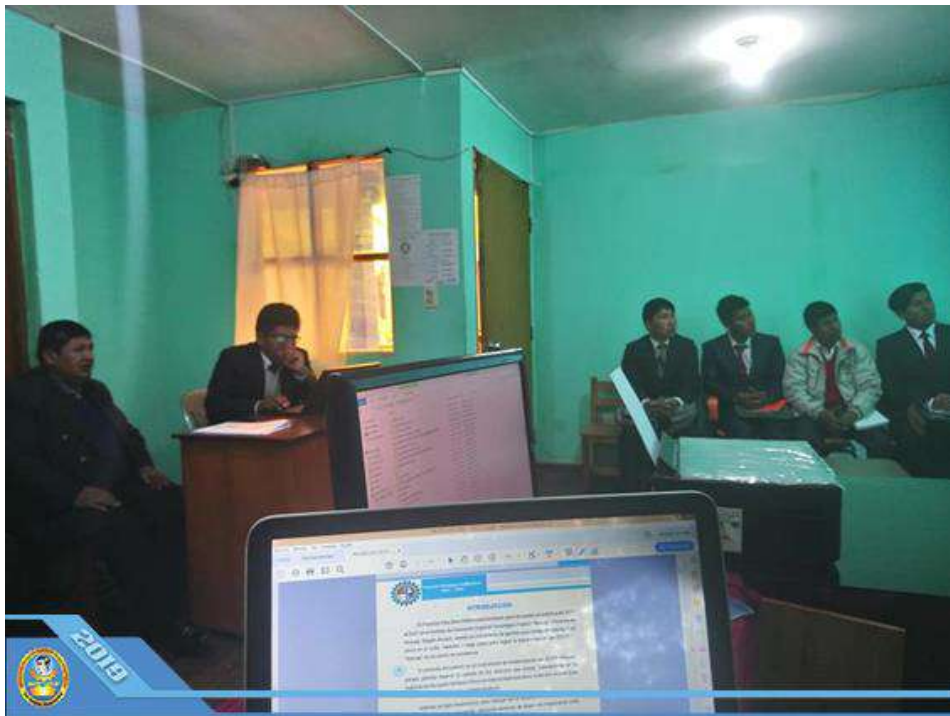
Diagnóstico de situación Actual – IESTP – José Domingo Choquehuanca