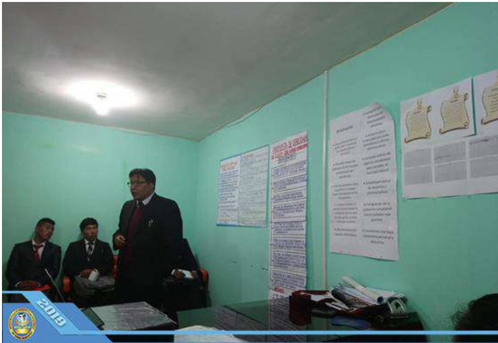
Análisis del FODA del IESTP – José Domingo Choquehuanca