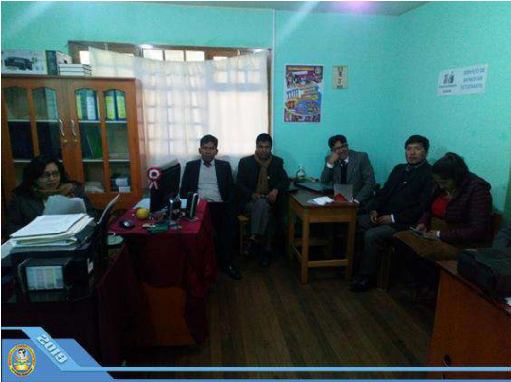
Gestión Estratégica, Formación Integral, Soporte y Resultados